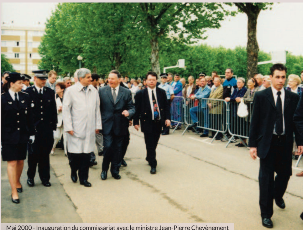
Mai 2000 - Inauguration du commissariat avec le ministre Jean-Pierre Chevènement