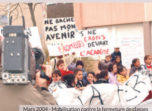
Mars 2004 - Mobilisation contre la fermeture de classes