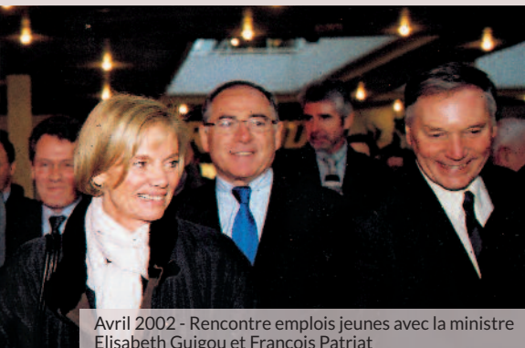
Avril 2002 - Rencontre emplois jeunes avec la ministre Elisabeth Guigou et François Patriat