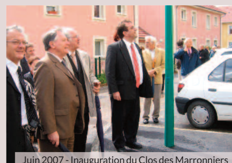
Juin 2007 - Inauguration du Clos des Marronniers