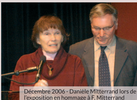
Décembre 2006 - Danièle Mitterrand lors de l'exposition en hommage à F. Mitterrand