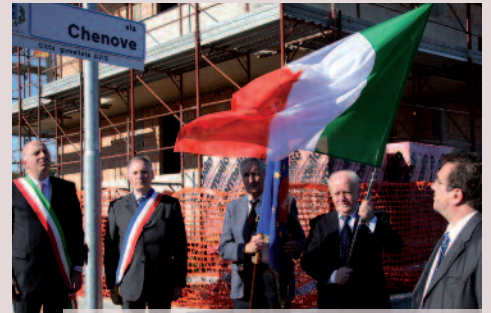
Octobre 2008 - Une rue 'Chenève' à Parabiago