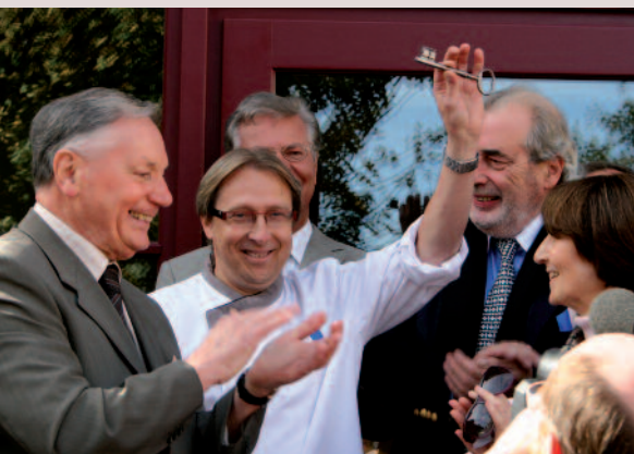
Septembre 2010 - Ouverture de l'Auberge du Clos du Roy