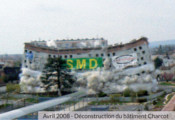
Avril 2008 - Déconstruction du bâtiment Charcot