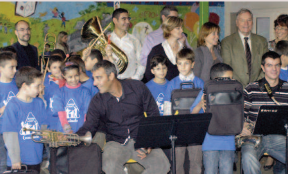
Octobre 2011 - Création de l'Orchestre à l'école