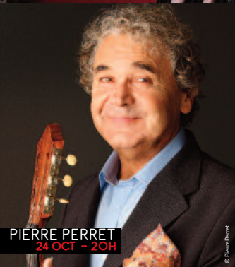
PIERRE PERRET 24 OCT - 20H