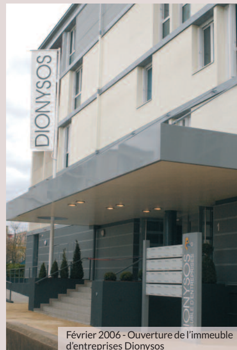
Février 2006 - Ouverture de l'immeuble d'entreprises Dionysos