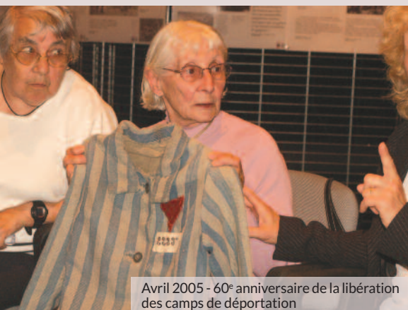
Avril 2005 - 60 e anniversaire de la libération des camps de déportation