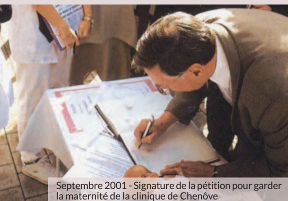
Septembre 2001 - Signature de la pétition pour garder la maternité de la clinique de Chenôve