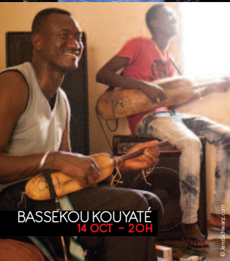
BASSEKOU KOUYATÉ 14 OCT - 20H