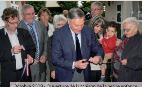
Octobre 2008 - Ouverture de la Maison de la petite enfance