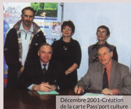
Décembre 2001 - Création de la carte Pass'port culture