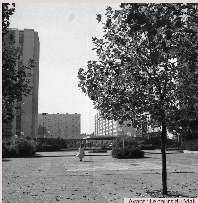
Avant : Le cours du Mail