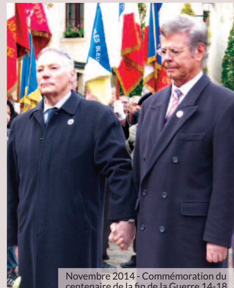
Novembre 2014 - Commémoration du centenaire de la fin de la Guerre 14-18