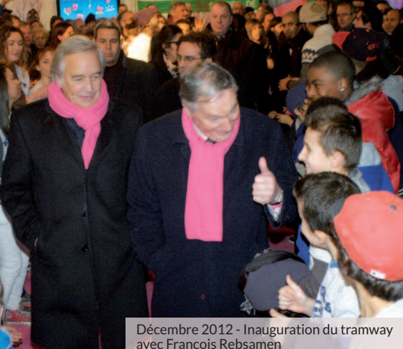
Décembre 2012 - Inauguration du tramway avec François Rebsamen