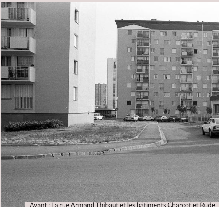
Avant : La rue Armand Thibaut et les bâtiments Charcot et Rude