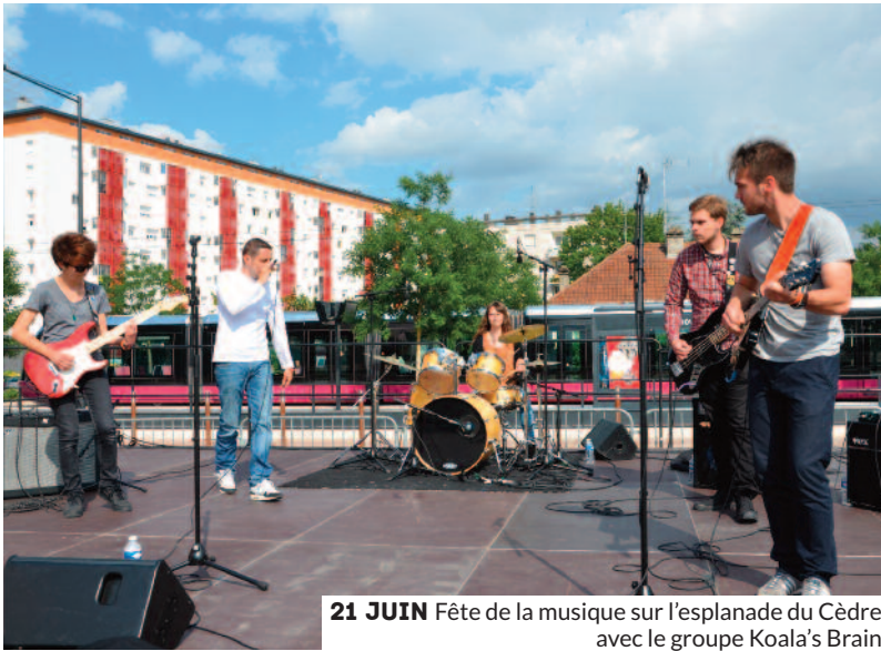
21 JUIN Fête de la musique sur l'esplanade du Cèdre avec le groupe Koala's Brain