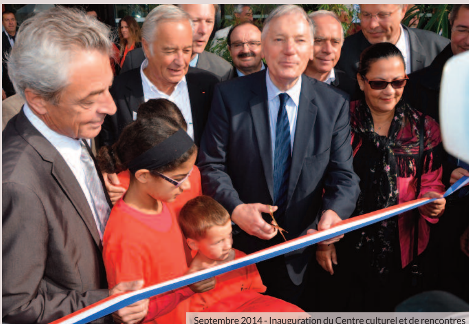
Septembre 2014 - Inauguration du Centre culturel et de rencontres