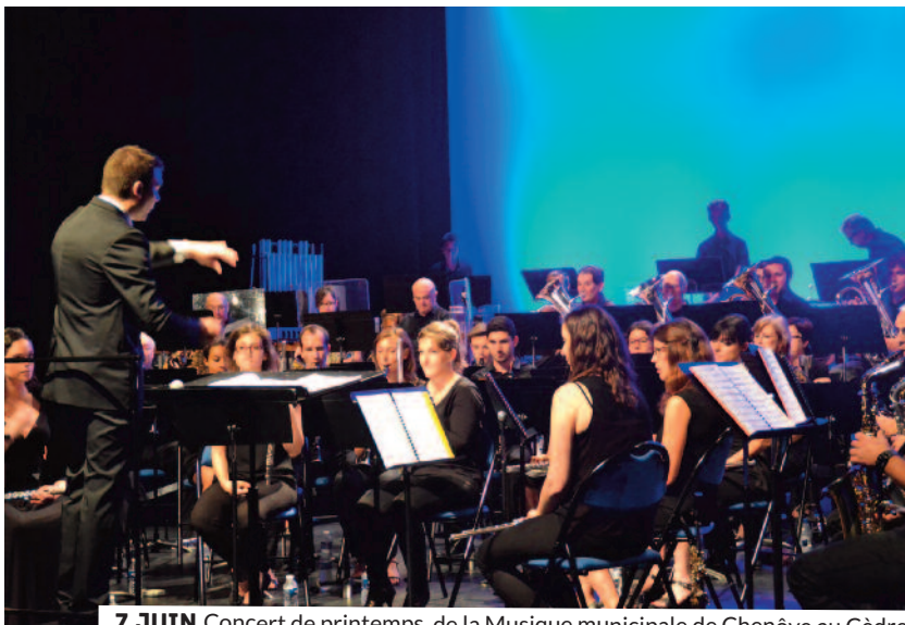
7 JUIN Concert de printemps de la Musique municipale de Chenôve au Cèdre