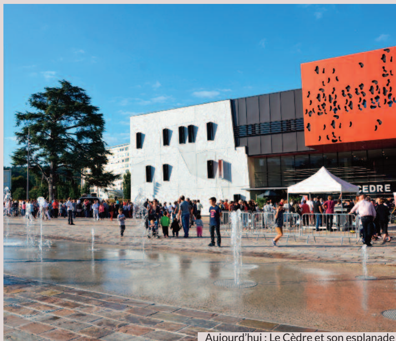
Aujourd'hui : Le Cèdre et son esplanade