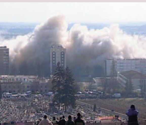
Février 2004 - Déconstruction du bâtiment Péguy