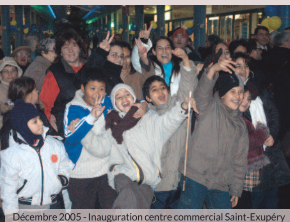
Décembre 2005 - Inauguration centre commercial Saint-Exupéry