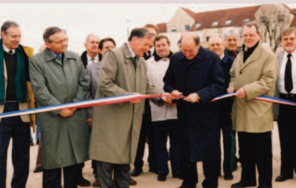
Décembre 2000 - Lancement de l'aménagement du Clos du Roy