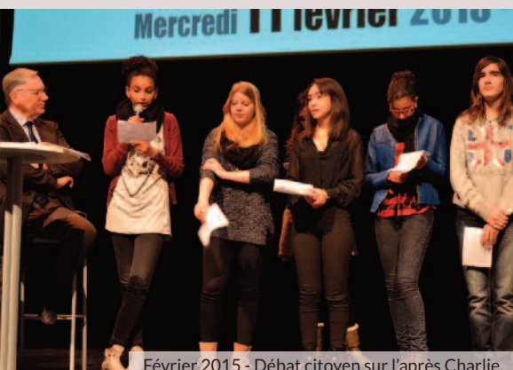
Février 2015 - Débat citoyen sur l'après Charlie