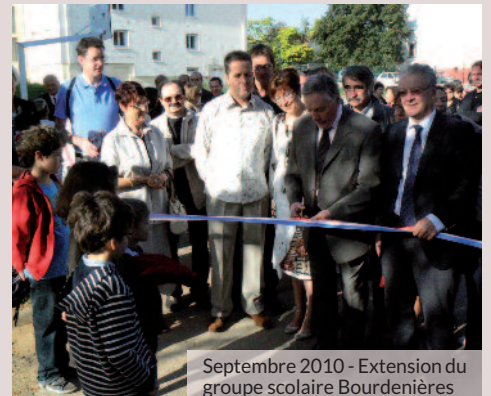
Septembre 2010 - Extension du groupe scolaire Bourdenières