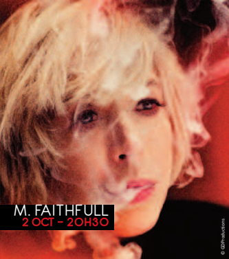
M. FAITHFULL 2 OCT - 20H30