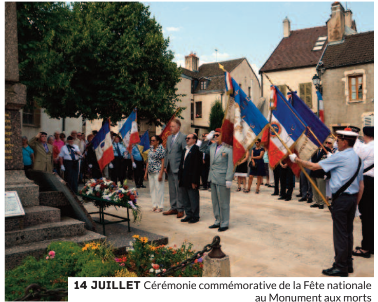
14 JUILLET Cérémonie commémorative de la Fête nationale au Monument aux morts