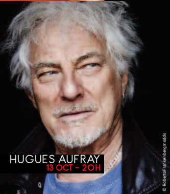
HUGUES AUFRAY 18 OCT - 20H