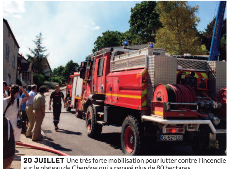
20 JUILLET Une très forte mobilisation pour lutter contre l'incendie sur le plateau de Chenôve qui a ravagé plus de 80 hectares