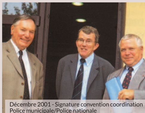
Décembre 2001 - Signature convention coordination Police municipale/Police nationale