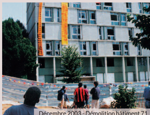
Décembre 2003 - Démolition bâtiment 71