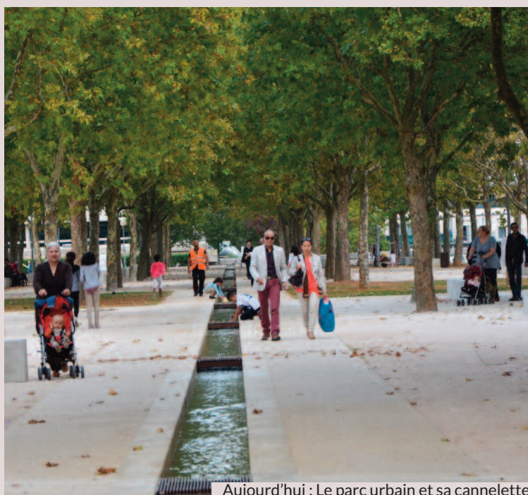
Aujourd'hui : Le parc urbain et sa cannellette