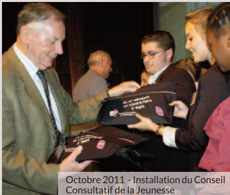
Octobre 2011 - Installation du Conseil Consultatif de la Jeunesse