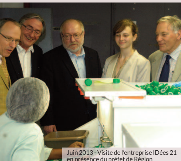
Juin 2013 - Visite de l'entreprise IDées 21 en présence du préfet de Région