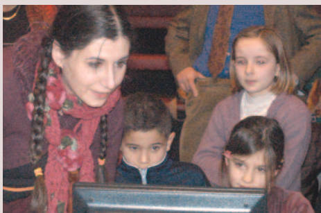
Avril 2005 - Création de l'Espace Public Numérique