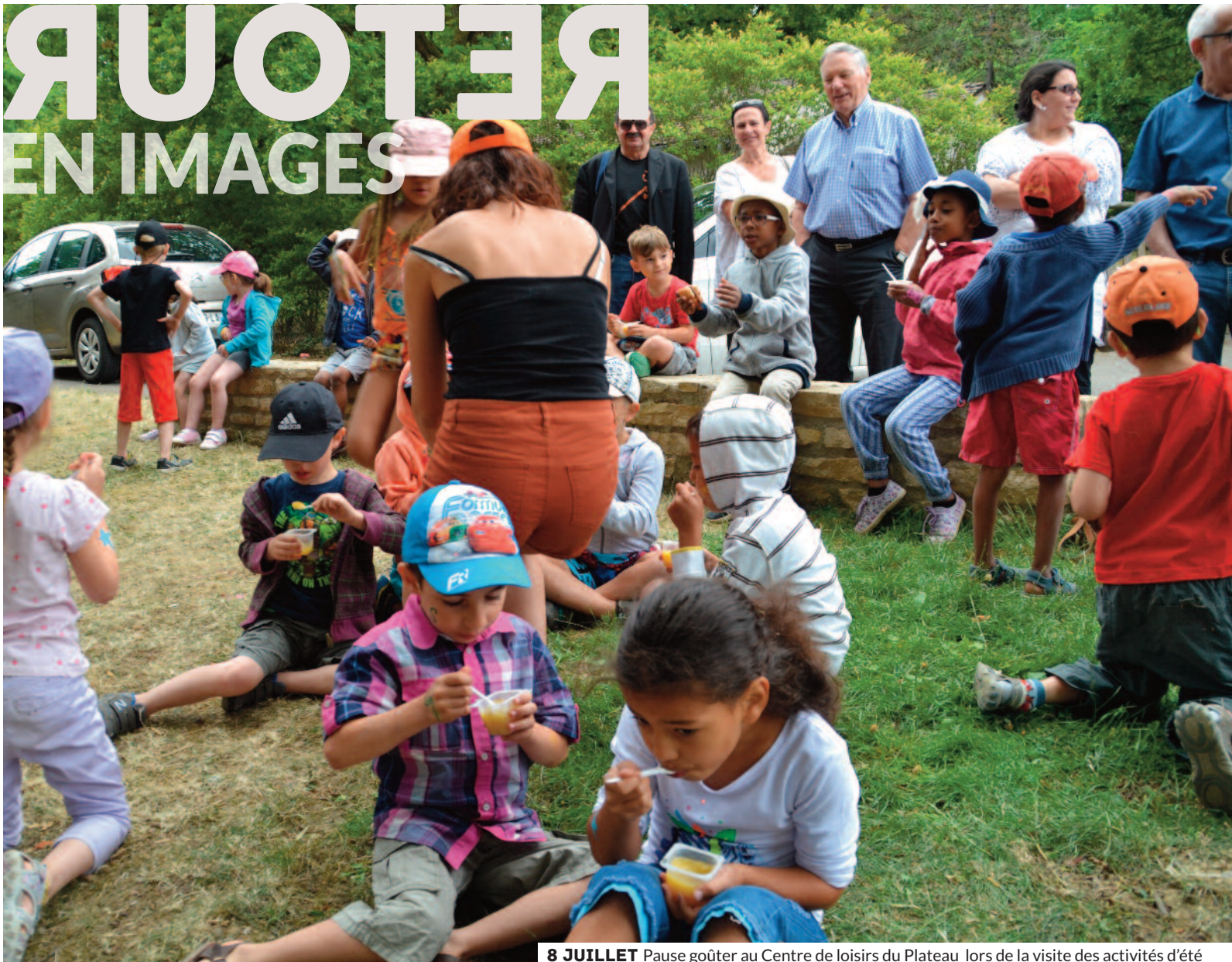
8 JUILLET Pause goûter au Centre de loisirs du Plateau lors de la visite des activités d'été