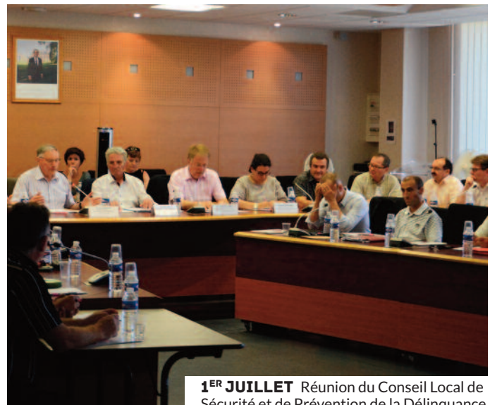
1 ER JUILLET Réunion du Conseil Local de Sécurité et de Prévention de la Délinquance