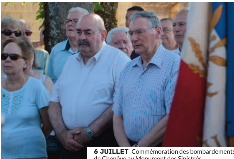
6 JUILLET Commémoration des bombardements de Chenôve au Monument des Sinistrés