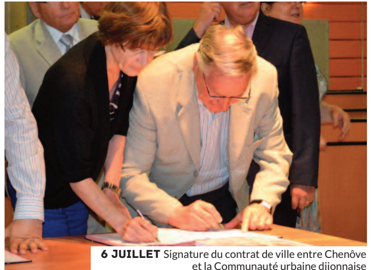
6 JUILLET Signature du contrat de ville entre Chenôve et la Communauté urbaine dijonnaise