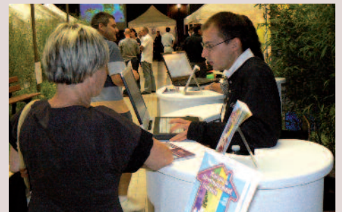
Septembre 2009 - Salon des économies d'énergies