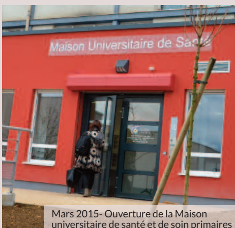
Mars 2015 - Ouverture de la Maison universitaire de santé et de soins primaires