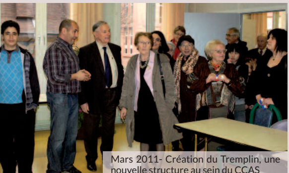
Mars 2011 - Création du Tremplin, une nouvelle structure au sein du CCAS